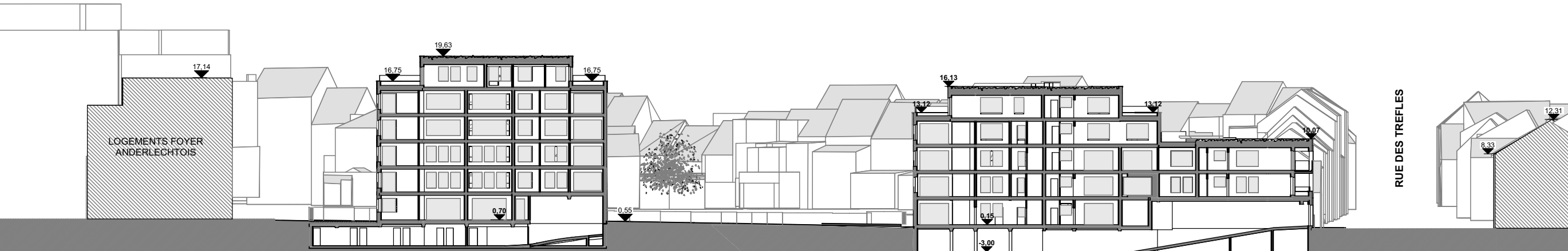
COUPE DE PROFIL G1