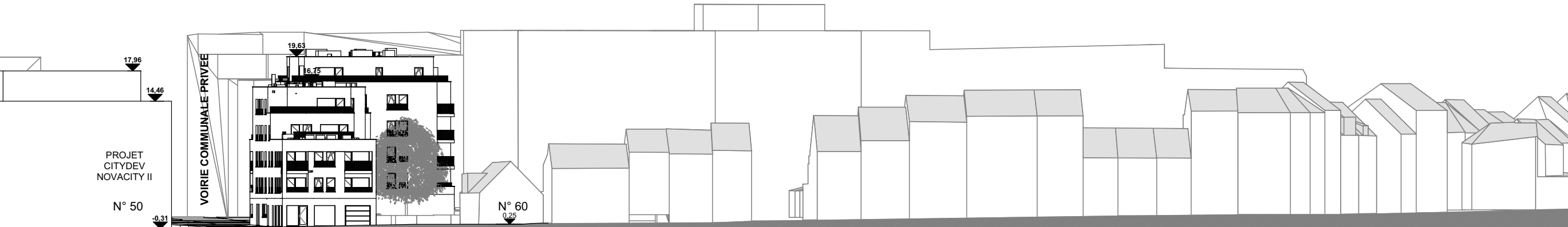
COUPE DE PROFIL G3