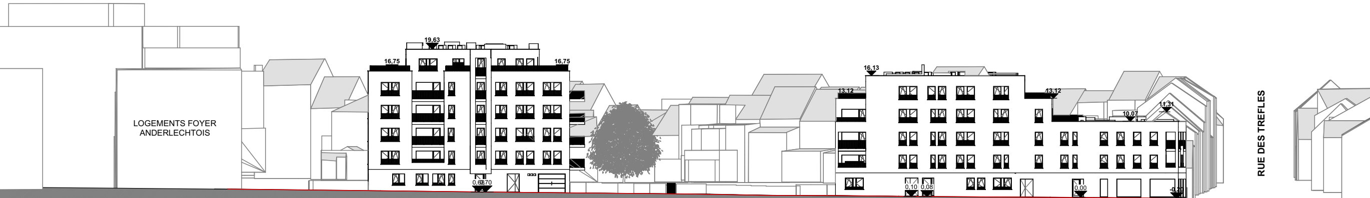
COUPE DE PROFIL G2